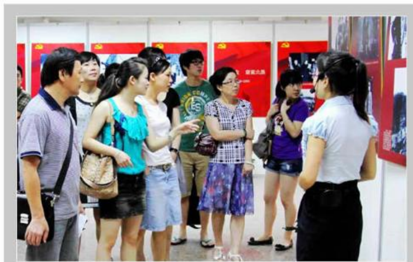
图 片 新 闻

会后进行了灭火演练,员工们逐一进行了现场试用灭火器,使他们熟悉掌握灭火器材的使用和操作。