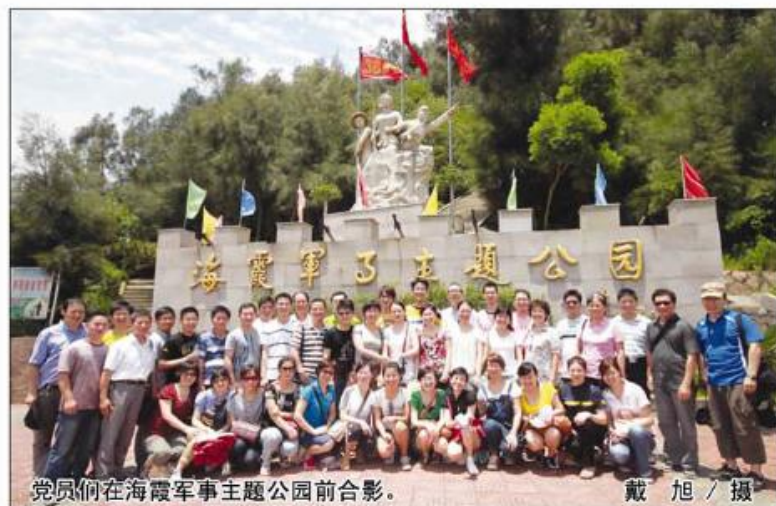
党员们在海霞军事主题公园前合影。

闪烁党徽,飘扬党旗。 中华日新,多彩魅力。 历史见证,辉煌佳绩。 九十华诞,七一献礼。