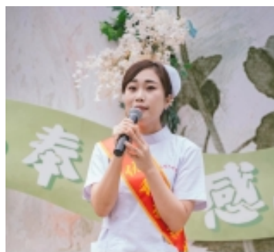
抗击新冠肺炎疫情坚守前线杰出护士

全国多地暴发新冠疫情，温州成了重灾区，做为一名护士我主动报名请缨，参加前线工作。大年初二，我接到通知，要赴温六院支援，成为首批“新冠肺炎”护理驰援队成员。一早，来不及与孩子告别，悄然出发了。