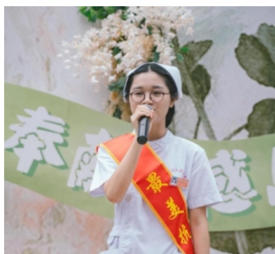
抗击新冠肺炎疫情逆行援鄂杰出护士

年三十晚上十一点多接到援鄂任务，第二天一早在温州市委集合出发武汉，当时我突然开始有些害怕，也不敢告诉爸妈，第二天早上四点多，我就悄悄洗漱，匆匆跑出了家门。到达市委时，在看到他们与家人离别的时候，我也想起来爸妈，直到坐上大巴车，我才通过微信告诉他们我去武汉了。