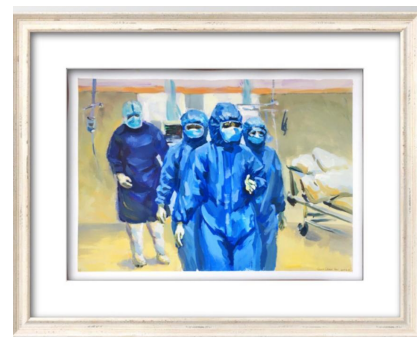
作品：《逆行中的战士》作者：A14 病区 叶海静、郭超慧