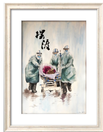
作品：《摆渡》作者：二十三病区 温婷婷